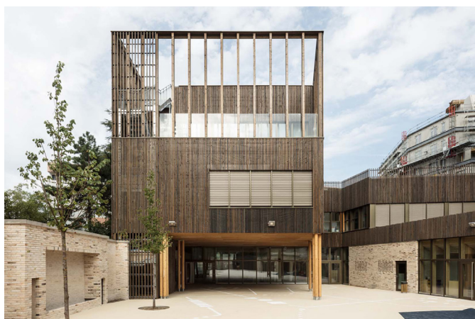
RECONSTRUCTION/EXTENSION D'UNE ECOLE MATERNELLE DE 6 CLASSES 90, boulevard Vincent Auriol - Paris 13ème

Avancement opération Etudes : 2015-2017 Chantier : 2017-2019 Livré : Août 2019