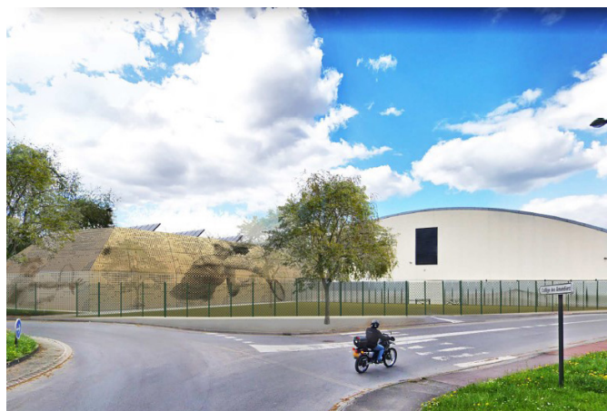
EXTENSION DU STADE DES AMANDIERS ET REQUALIFICATION DES ABORDS Carrières sur Seine (78)