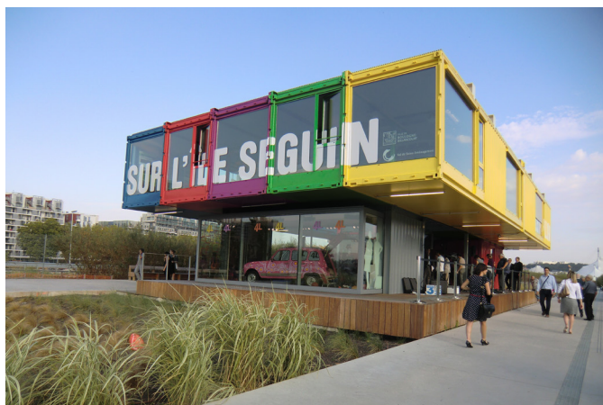
PAVILLON D'INFORMATION SUR L'ÎLE SEGUIN Boulogne Billancourt (92)