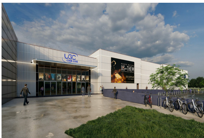
CONSTRUCTION D'UN CINEMA DE 9 SALLLES Les Ulis (91)