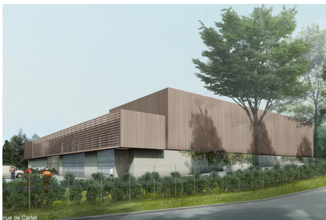
CONSTRUCTION DU NOUVEAU CENTRE TECHNIQUE MUNICIPAL Chilly Mazarin (91)