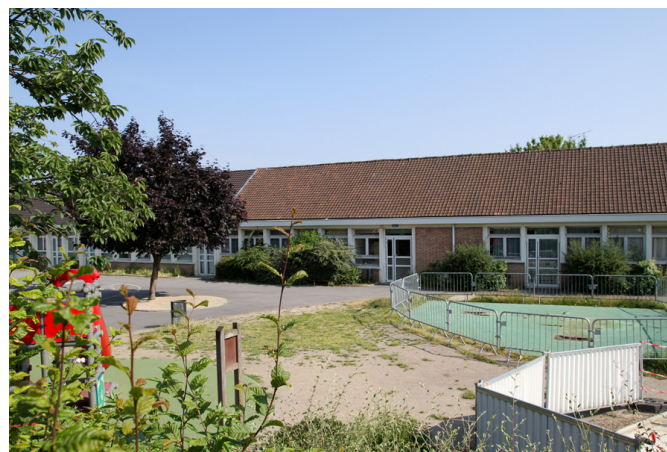
RECONSTRUCTION PARTIELLE DU GROUPE SCOLAIRE JEAN ZAY Saint Gratien (95)