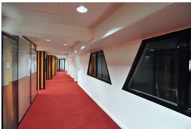
AMENAGEMENT DE BUREAUX POUR LA DASCO 76bis, Rue de Rennes – Paris 6ème