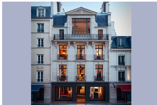
AMENAGEMENT D'UN SHOWROOM LIAIGRE 77, rue du faubourg Saint-Honoré à Paris 8ème

Avancement opération Etudes : 2016-2017 Chantier : 2017-2019 Livré : Juillet 2019