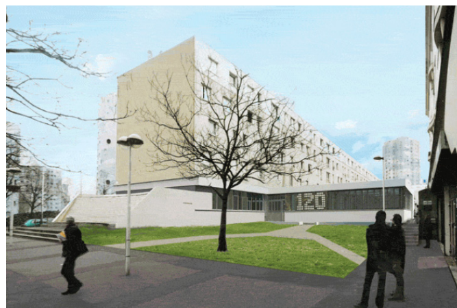
AMENAGEMENT D'UN EQUIPEMENT SOCIOCULTUREL DEDIE A LA JEUNESSE Nanterre (92)