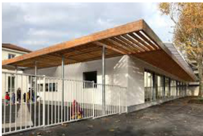
RECONSTRUCTION DE LA RESTAURATION DU GROUPE SCOLAIRE JULES VALLES Saint-Denis (93)