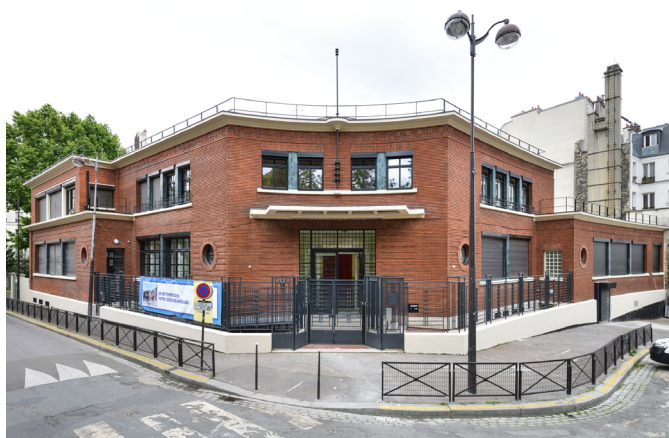
REAMENAGEMENT D'UNE CRECHE ET D'UNE PMI 3, square Alban Satragne – Paris 10ème