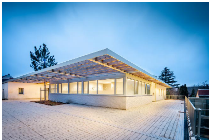
CONSTRUCTION D'UNE STRUCTURE MULTI-ACCUEIL PETITE ENFANCE Noisy-le-Roi (78)