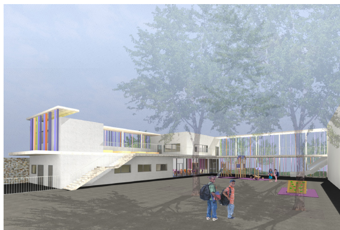
CONSTRUCTION D'UN RESTAURANT SCOLAIRE ET D'UNE SALLE DE CLASSE A L'ECOLE MATERNELLE JACQUELINE QUATREMAIRE Pantin (93)