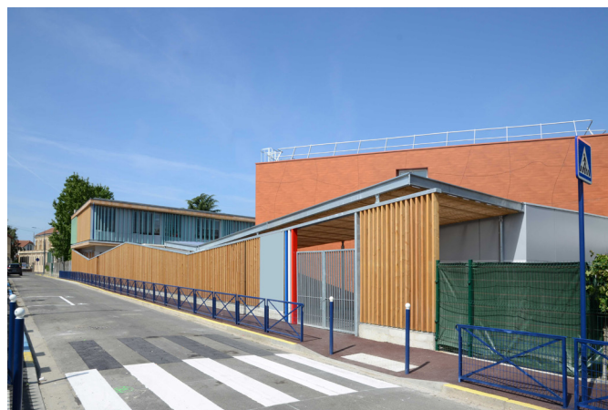
EXTENSION ET REAMENAGEMENT DE L'ECOLE MATERNELLE JEAN MACE Drancy (93)

Avancement opération Etudes : 2017-2018 Chantier : 2018-2019 Livré : Juin 2019