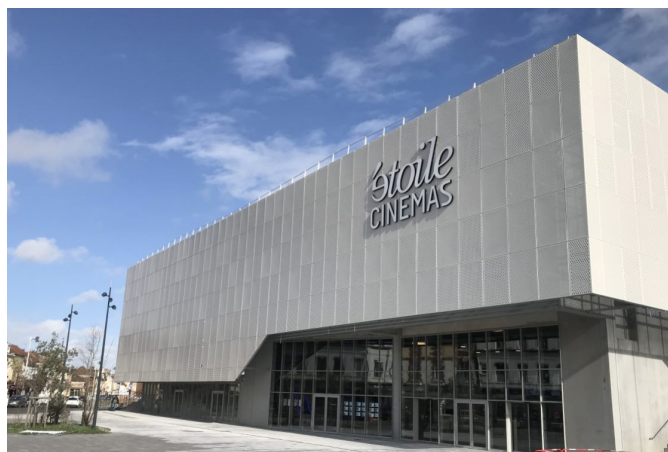
CONSTRUCTION D'UN CINEMA DE 9 SALLLES AVEC 2 COMMERCES EN RDC Béthune (62)