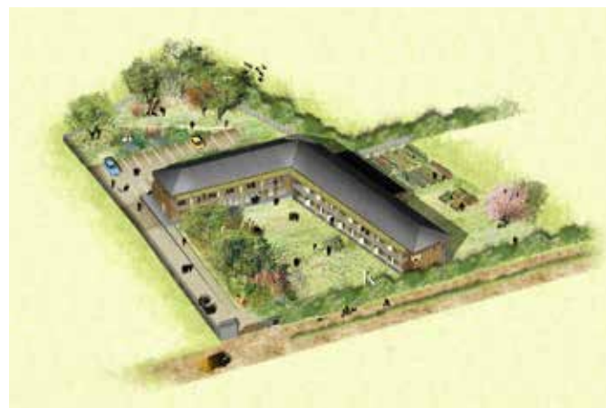
CONSTRUCTION D'UNE RESIDENCE POUR PERSONNES AGEES AUTONOMES ACCUEILLANT 24 RESIDENTS Pontgouin (28)