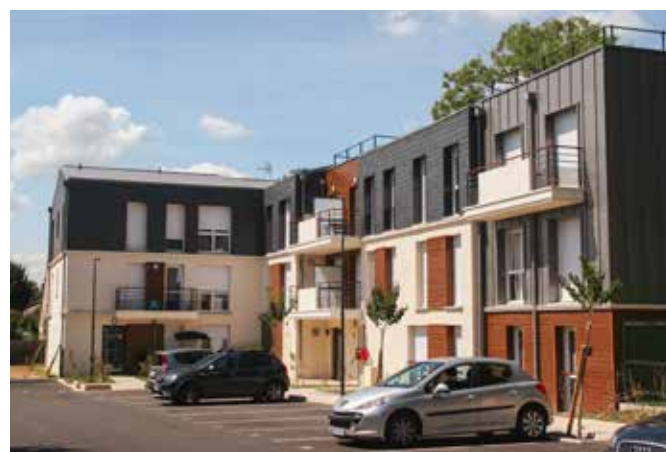
CONSTRUCTION DE 22 LOGEMENTS LOCATIFS SOCIAUX Margency (95)