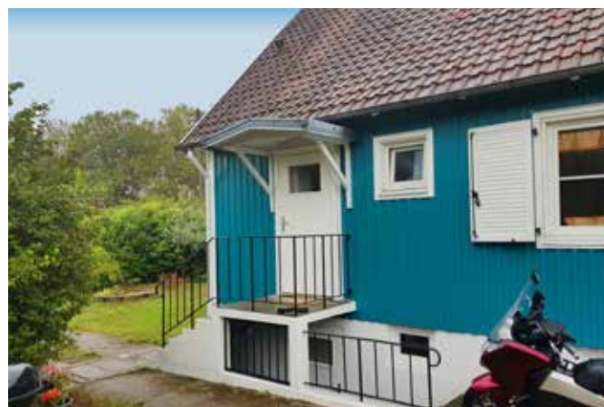
REHABILITATION DE 93 LOGEMENTS INDIVIDUELS Site occupé Saint Etienne du Rouvray (76)