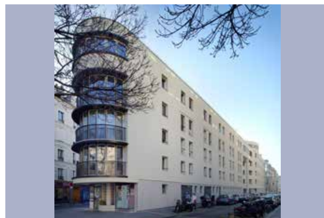
AMELIORATION DES PERFORMANCES THERMIQUES D'UN IMMEUBLE COMPOSE DE 55 LOGEMENTS Site occupé & présence d'amiante 5/7, rue Guilleminot – Paris 14ème