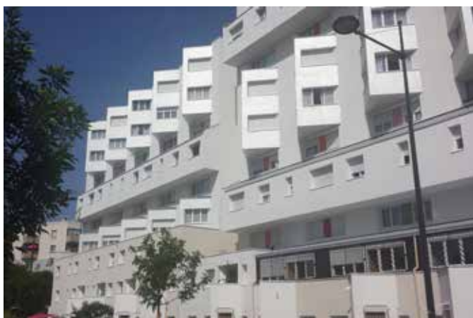
AMELIORATION DES PERFORMANCES THERMIQUES DE 320 LOGEMENTS SUR PLUSIEURS IMMEUBLES COLLECTIFS Site occupé Argenteuil (95)