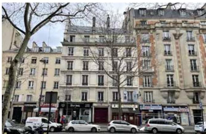
RÉHABILITATION D'UN IMMEUBLE DE 13 LOGEMENTS ET 2 LOCAUX D'ACTIVITÉ - Site occupé Avenue Ledru Rollin - 75012 Paris