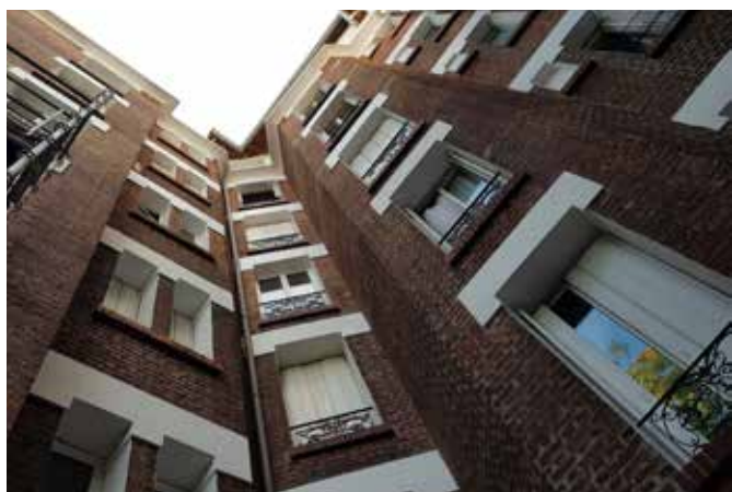
REHABILITATION TCE DE 107 LOGEMENTS COLLECTIFS REPARTIS SUR 11 ADRESSES - Site occupé Saint Ouen (93)