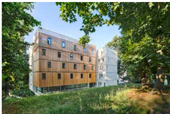
LA FRESQUE - CONSTRUCTION D'UNE RESIDENCE 60 LOGEMENTS ETUDIANTS Versailles (78)