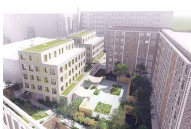
CONSTRUCTION DE 25 LOGEMENTS, D'UNE CRECHE, REHABILITATION DE PARKINGS ET AMENAGEMENT DES ESPACES EXTERIEURS Rue Van Loo – Paris 16ème