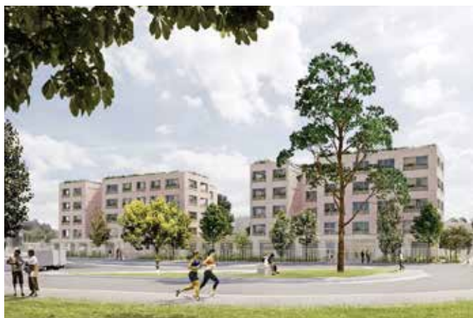
CONSTRUCTION DE 40 LOGEMENTS COLLECTIFS Dreux (28)