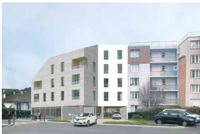
CONSTRUCTION DE 11 LOGEMENTS SOCIAUX ET UN COMMERCE Gagny (93)