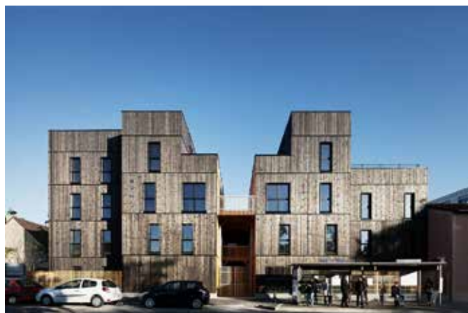
CONCEPTION REALISATION POUR LA CONSTRUCTION DE 35 LOGEMENTS SOCIAUX 3, rue Etienne Dolet (18 logements) 49, rue Edouard Branly (17 logements) - Montreuil (93)