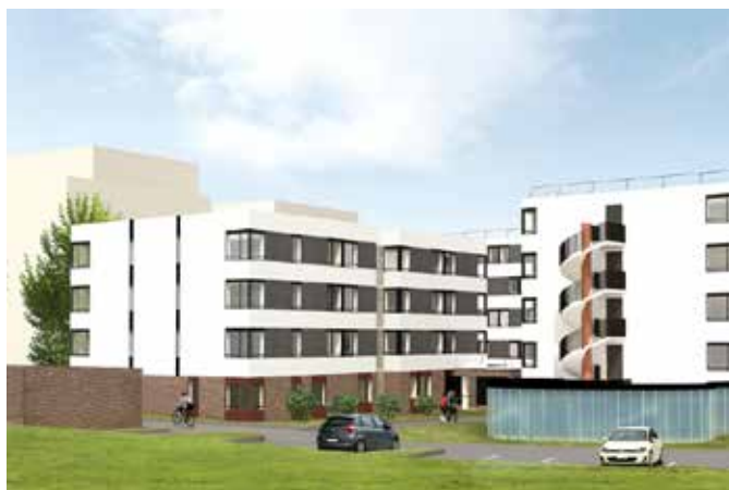
EXTENSION ET RESTRUCTURATION LOURDE DU FOYER SEINE ET OISE Conflans Sainte Honorine (78)