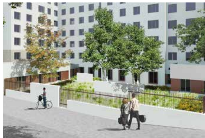
CREATION DE 11 LOGEMENTS COLLECTIFS A LA PLACE D'UNE CRECHE EXISTANTE 38, rue Piat – Paris 20ème