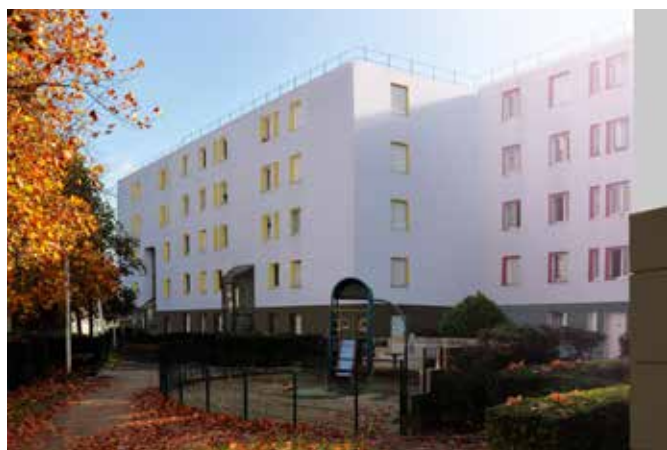
REHABILITATION DE 93 LOGEMENTS ET RESIDENTIALISATION DES ESPACES EXTERIEURS DU GROUPE MAX JACOB Site occupé & présence d'amiante Orly (91)