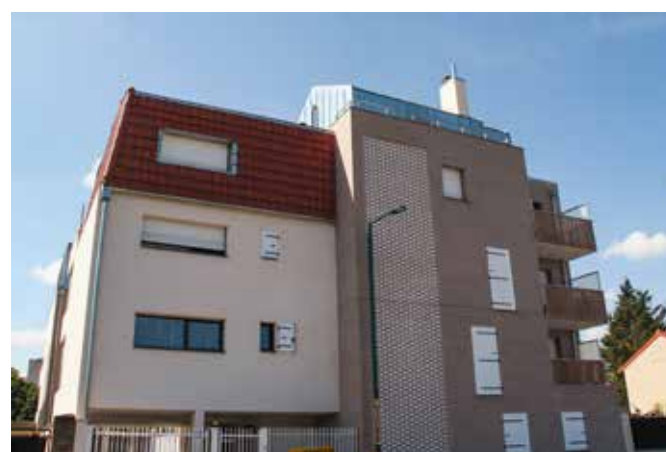
CONSTRUCTION D'UN ENSEMBLE IMMOBILIER DE 23 LOGEMENTS EN ACCESSION Gennevilliers (92)