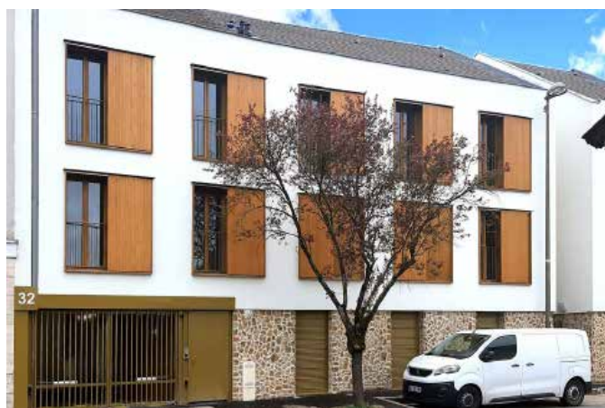
CONSTRUCTION DE 18 LOGEMENTS Voisins-le-Bretonneux (78)