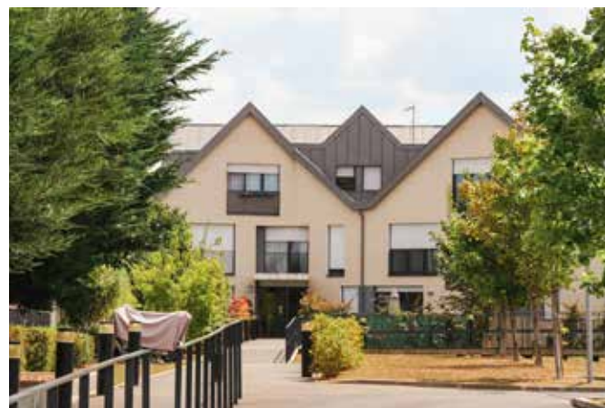
CONSTRUCTION DE 25 LOGEMENTS COLLECTIFS A MONTESSON Montesson (78)