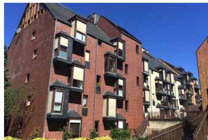
TRAVAUX DE RAVALEMENT, TOITURE ET REHABILITATION DES SALLES COMMUNES DE LA RESIDENCE MADELAINE WAGNER Site occupé Vélizy-Villacoublay (78)