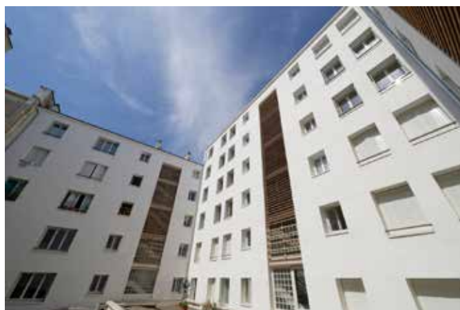
REQUALIFICATION D'UN IMMEUBLE DE 43 LOGEMENTS Site occupé & présence d'amiante 54/56 rue d'Aboukir – Paris 2ème