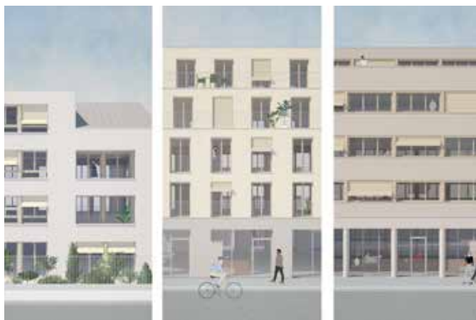
CONSTRUCTION DE 87 LOGEMENTS SOCIAUX ET UN LOCAL COMMERCIAL Aulnay-sous-Bois (93)