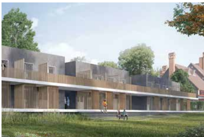
CONSTRUCTION D'UNE RESIDENCE SOCIALE ET D'UNE PENSION DE FAMILLE Essomes-sur-Marne (02)