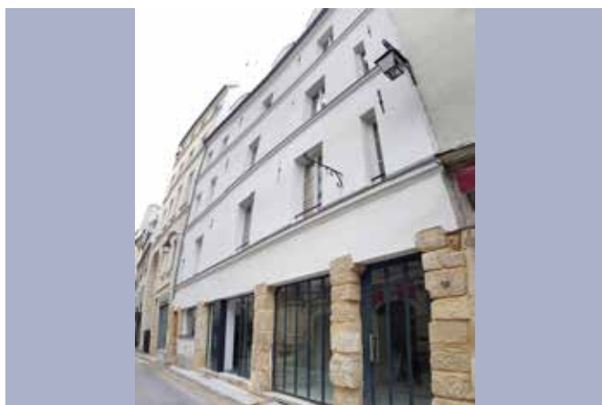
REHABILITATION LOURDE D'UN ENSEMBLE IMMOBILIER POUR LA CREATION DE 12 LOGEMENTS 10 rue Laplace – Paris 5ème