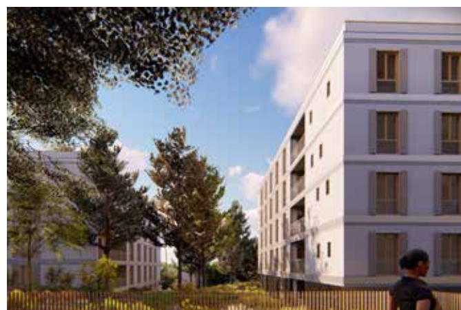
CONSTRUCTION DE 42 LOGEMENTS, DEMOLITION-RECONSTRUCTION DE 50 LOGEMENTS ET AMENAGEMENT PAYSAGER Verrières le Buisson (91)