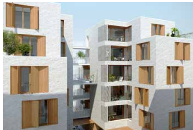
CONSTRUCTION DE 13 LOGEMENTS SOCIAUX AINSI QU'UN EQUIPEMENT PETITE ENFANCE ET UN LOCAL D'ACTIVITE Passages Driancourt & Brulon – Paris 12ème