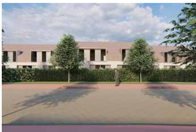
CONSTRUCTION DE 10 MAISONS INDIVIDUELLES La Rochette (77)