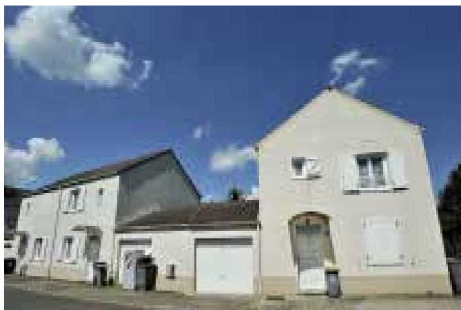
REHABILITATION THERMIQUE DE 80 PAVILLONS Nandy (77)