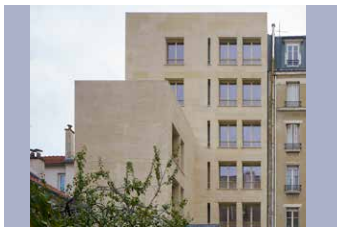
CONSTRUCTION DE 9 LOGEMENTS SOCIAUX ET UNE SURFACE COMMERCIALE Rue des Cévennes – Paris 15ème