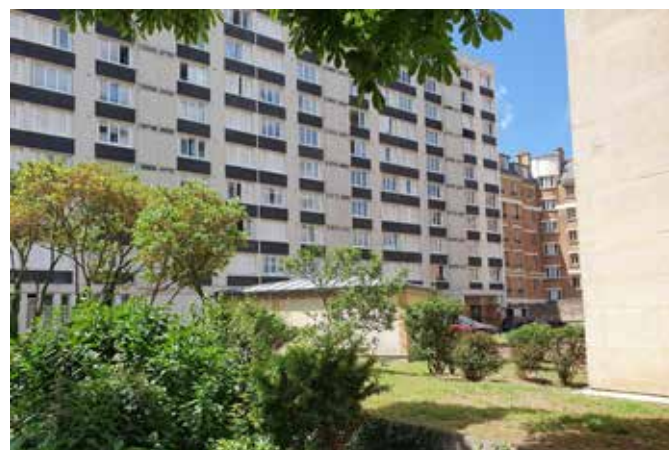
REHABILITATION DE 132 LOGEMENTS REPARTIS SUR 2 BATIMENTS - Site occupé & présence d'amiante Maisons Alfort (94)