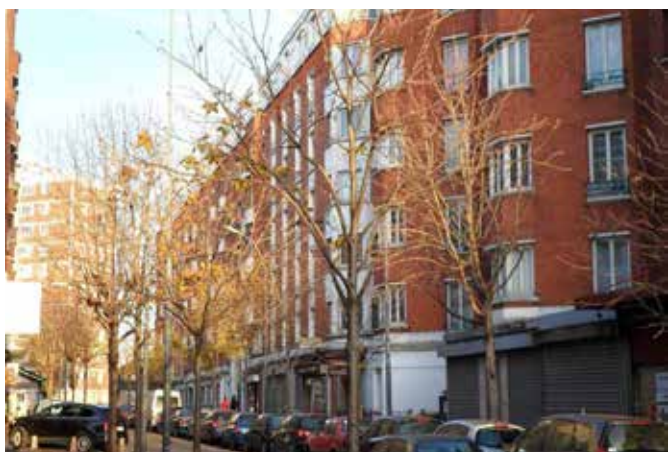
REHABILITATION DE 308 LOGEMENTS ET 15 LOCAUX COMMERCIAUX - Site occupé & présence d'amiante Saint Ouen (93)