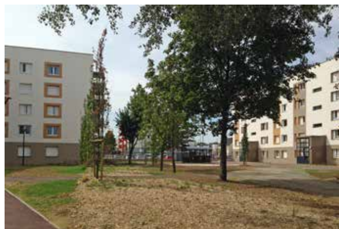
RENOUVELLEMENT URBAIN ET REHABILITATION DE BATIMENTS DU QUARTIER SCHWEITZER LAENNEC Site occupé & présence d'amiante Chelles (77)