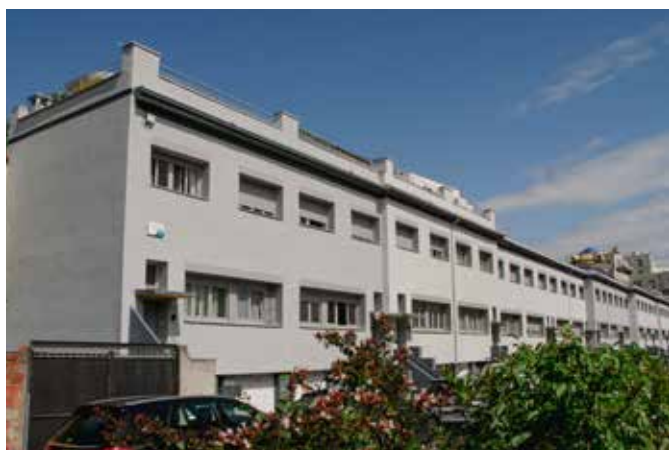
REHABILITATION DE 21 MAISONS INDIVIDUELLES EN BANDE Site occupé & présence d'amiante Colombes (92)

Avancement opération Etudes : 2018-2020 Chantier : 2020-2022 Livré Septembre 2022