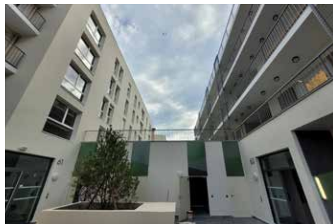
CONSTRUCTION DE 52 LOGEMENTS LOCATIFS Gentilly (94)