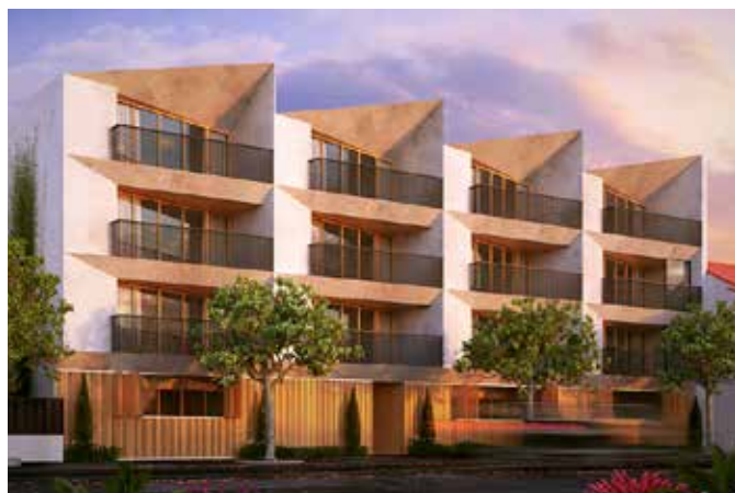
CONSTRUCTION DE 16 LOGEMENTS ET UN LOCAL D'ACTIVITES Montreuil (93)