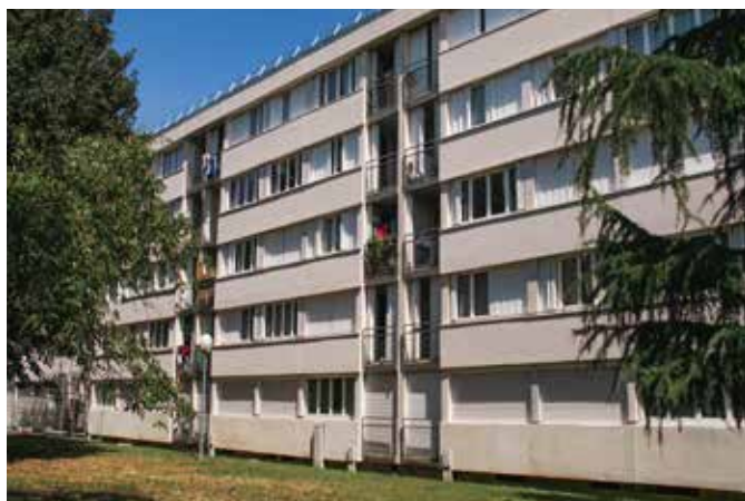
REHABILITATION DE 106 LOGEMENTS ET INTERVENTION SUR LES ESPACES EXTERIEURS - Site occupé & présence d'amiante Montmagny (95)