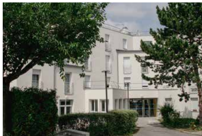
REHABILITATION D'UN HOTEL EN RESIDENCE SOCIALE Orly (94)