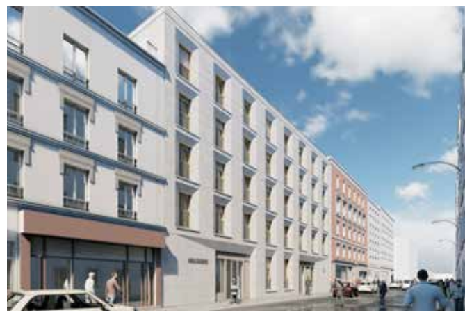
CONSTRUCTION DE 2 ENSEMBLES IMMOBILIERS : 13 LOGEMENTS AVEC UNE CRECHE EN RDC ET 8 LOGEMENTS Pantin (93)