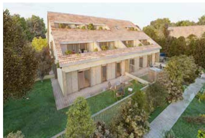
REQUALIFICATION D'UN ENSEMBLE IMMOBILIER DE BUREAUX EN 12 LOGEMENTS Villennes sur Seine (78)