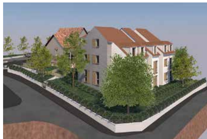
CONSTRUCTION DE 9 LOGEMENTS COLLECTIFS ET TRANSFORMATION D'UNE MAISON EXISTANTE EN 2 LOGEMENTS Jouars-Pontchartrain (78)