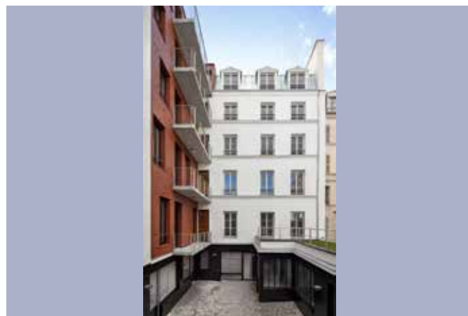
REHABILITATION LOURDE D'UN ENSEMBLE IMMOBILIER POUR LA CREATION DE 17 LOGEMENTS SOCIAUX ET DE 2 COM-MERCES 30, rue d'Enghien – Paris 10ème