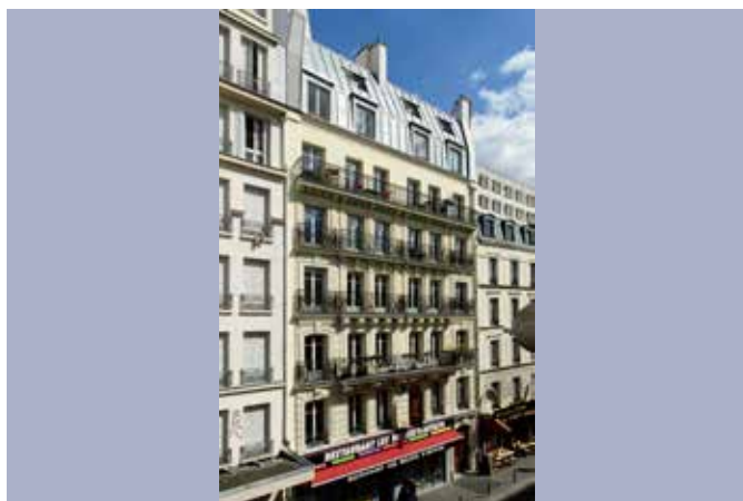
REHABILITATION DE 26 LOGEMENTS ET D'UN COMMERCE Site occupé & présence d'amiante 190, boulevard de la Villette – Paris 19ème