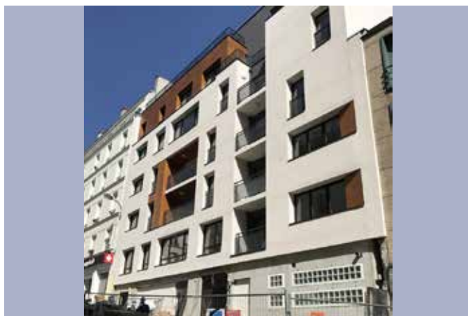
CONSTRUCTION DE 16 LOGEMENTS ET D'UN COMMERCE ET REHABILITATION DE 2 BATIMENTS DONT UN OCCUPE 20-22, rue Pradier – Paris 19ème