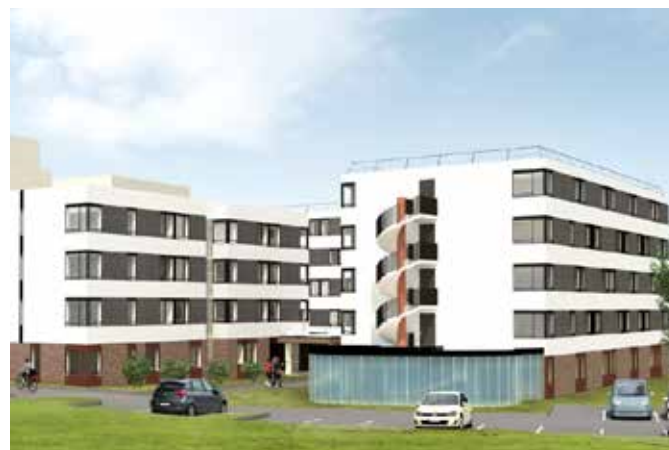
RESTRUCTURATION LOURDE ET EXTENSION DU FOYER SEINE ET OISE - Site occupé & présence d'amiante Conflans Sainte Honorine (78)