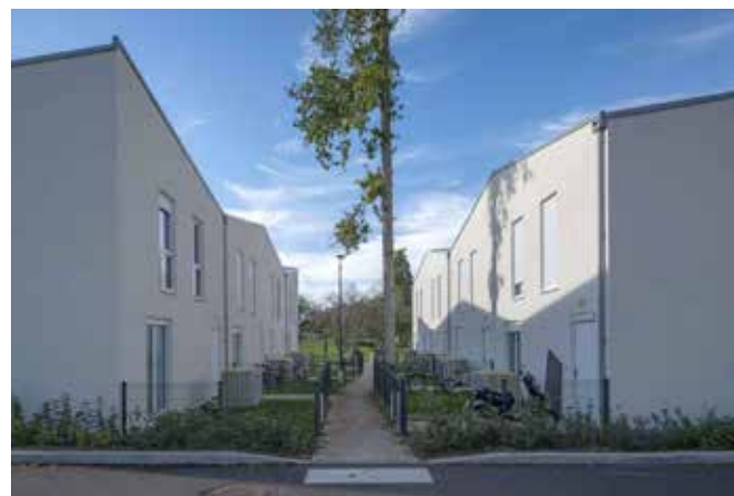
CONCEPTION REALISATION DE 33 LOGEMENTS LOCATIFS INDIVIDUELS SUR 2 SITES Le Perray en Yvelines (78)