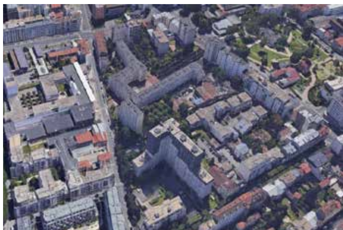
REHABILITATION THERMIQUE DE 239 LOGEMENTS DU GROUPE MOTOBECANE - Site occupé Pantin (93)