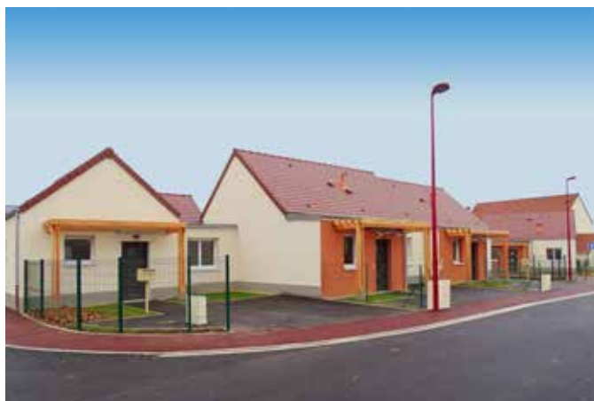
CONSTRUCTION DE 20 LOGEMENTS LOCATIFS INDIVIDUELS ET D'UNE SALLE POLYVALENTE Monéteau (89)

Maître d'Ouvrage OFFICE AUXERROIS DE L'HABITAT